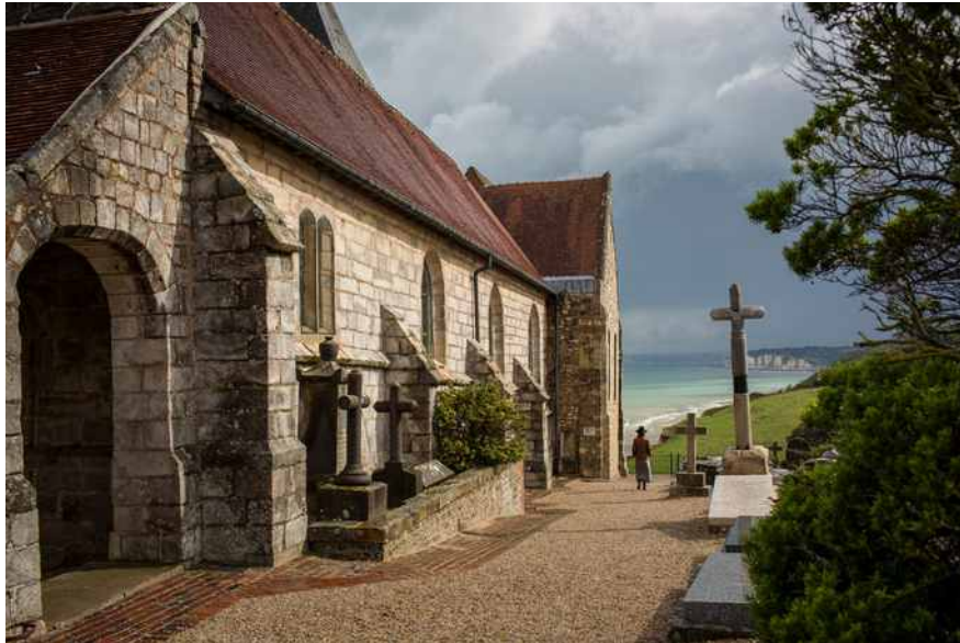
Nicole Strasser „Die Kirche Saint-Valéry in Varenville-sur-Mer“ SN/F 45 2017 Fine Art Print auf Hahnemühle Photomag Baryta 315g 40 x 60 cm Nr. 2/9