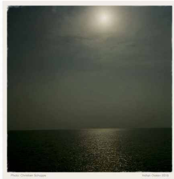
Christian Schoppe „Indian Ocean“ CS/F 79 2010 pigment print 80 x 60 cm Nr.4/20