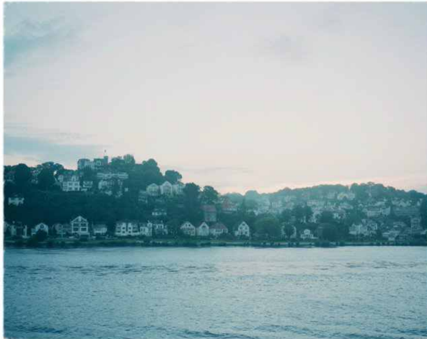
Christian Schoppe „Blankenese“ CS/F 75 2012 pigment print 60 x 80 cm Nr. 2/ 20