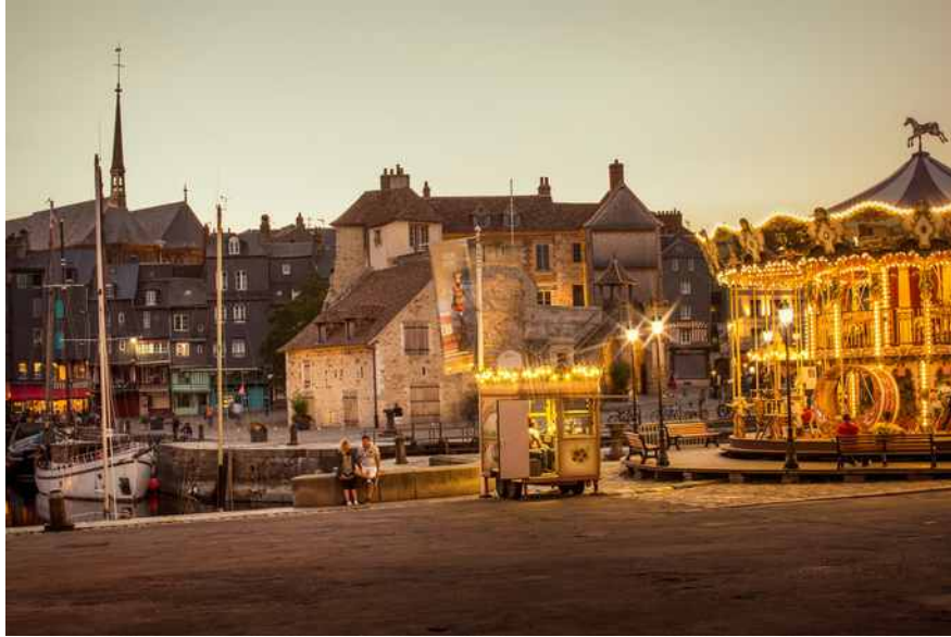
Nicole Strasser „Ein Karussell am Hafenbecken Le Vieux Bassin in Honfleur“ SN/F 44 2018 Fine Art Print auf Hahnemühle Photrag Baryta 315g 40 x 60 cm Nr. 2/9