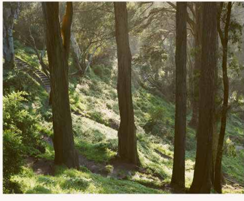
Christian Schoppe „San Francisco - USA“ CS/F 87 2011 pigment print 60 x 80 cm Nr. 2/ 20