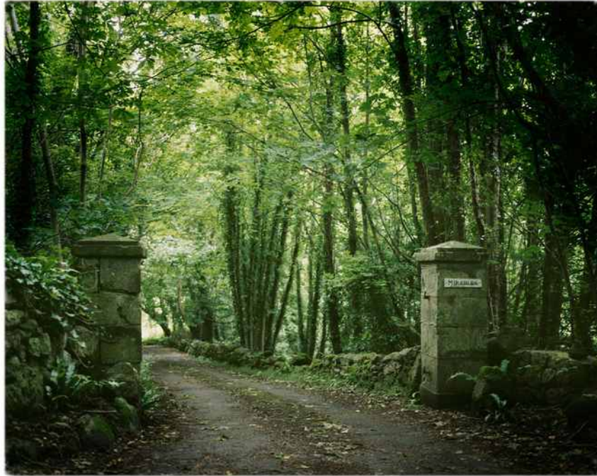
Christian Schoppe „Isle of Wight, UK“ CS/F 80 2012 pigment print 60 x 80 cm Nr. 2/ 20