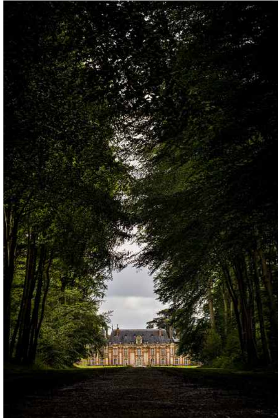
Nicole Strasser „Château de Miromesnil in Tourville-sur-Arques“ SN/F 49 2017 Fine Art Print auf Hahnemühle Photrag Baryta 315g 60 x 40 cm Nr. 2/9